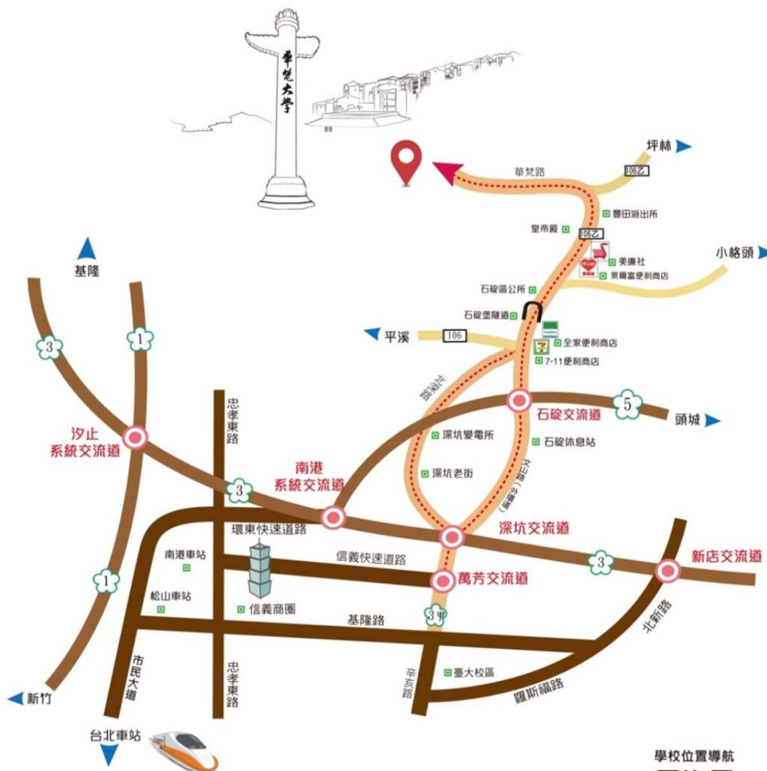
■ 華梵大學交通路線圖

本校交通業務單位：總務處事務組 02-26632102 分機 2422、2430